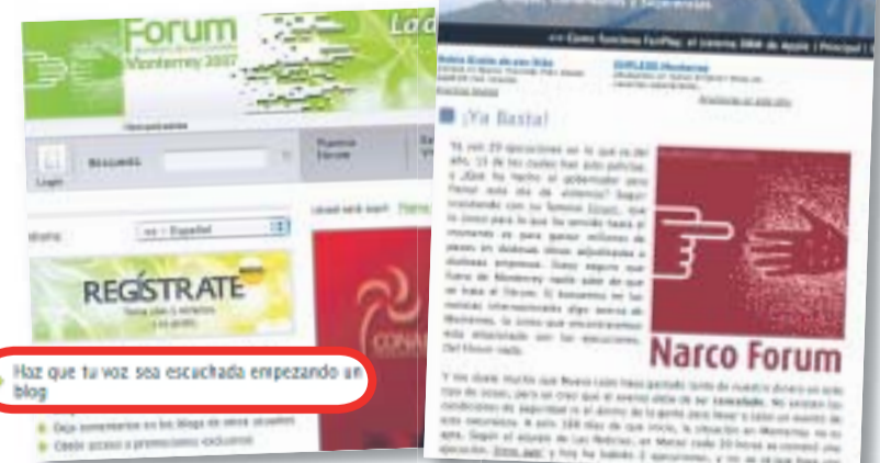
A través de la página web del Fórum (izq.), en la que se invita a crear blogs, se puede encontrar uno (der.) que pide cancelarlo y crea logo de “Narco Fórum”.

La información dice que Monterrey sólo destaca por las ejecuciones. “Me duele mucho que Nuevo León haya gastado tanto de nuestro dinero en este tipo de cosas, pero yo creo que el evento debe de ser cancelado”, menciona.